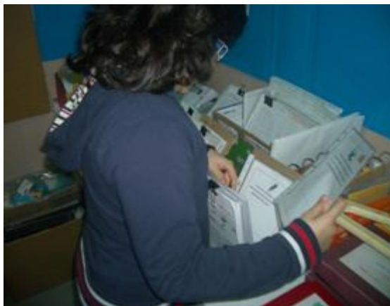
Fig.5 - Em TEA na zona de ficheiros de Matemática

Um tempo onde continuei a perceber as limitações da folha de papel que lhes entreguei e a que chamo PIT.