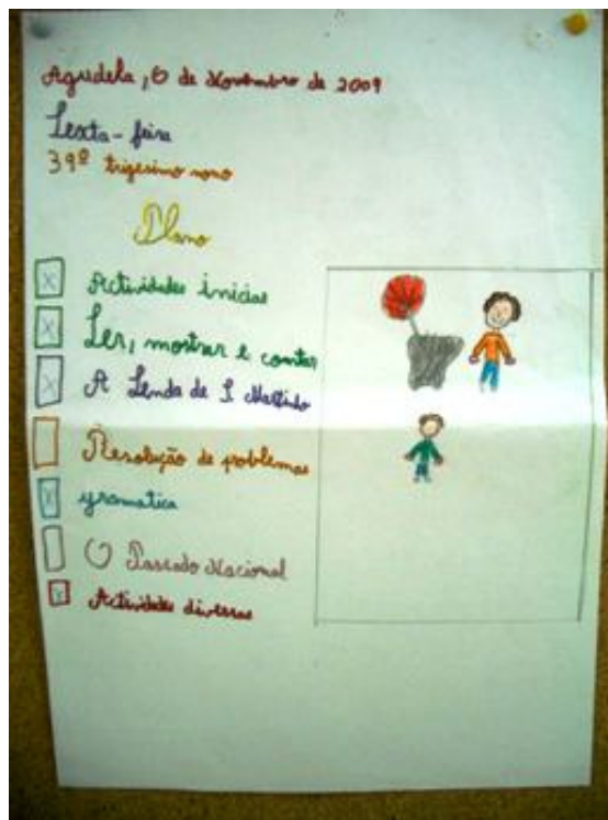
Plano do dia inicial