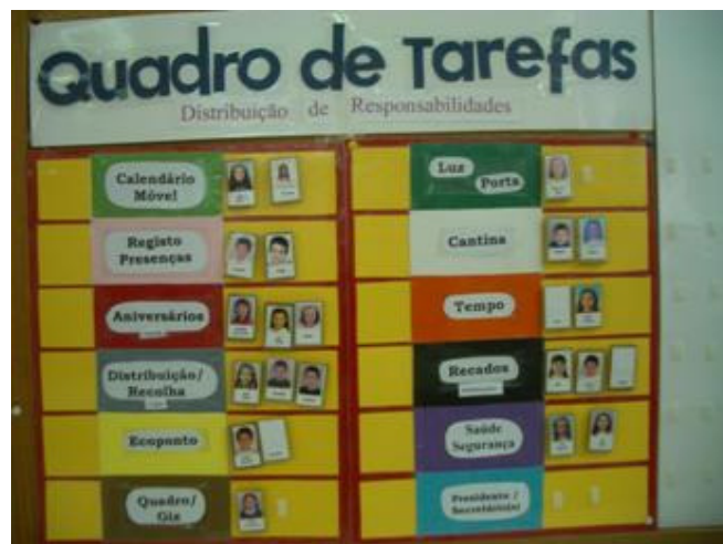
Quadro de distribuição de tarefas