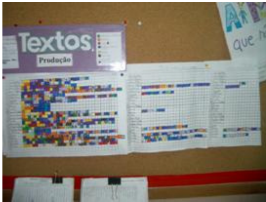
Fg.4 Mapa de registo da produção de textos

prática e funcional, sem grande rigidez estrutural.