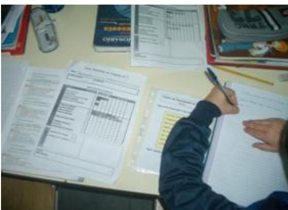
Fig.4 – Em tempo de Estudo Autónomo

Ficaram satisfeitos e animados quando lhes disse que íamos ter TEA novamente. Não tinha pensado em TEA, para este dia, aleatoriamente, quando uma das crianças me perguntou quais os dias em que iríamos ter Tempo de Estudo Autónomo.