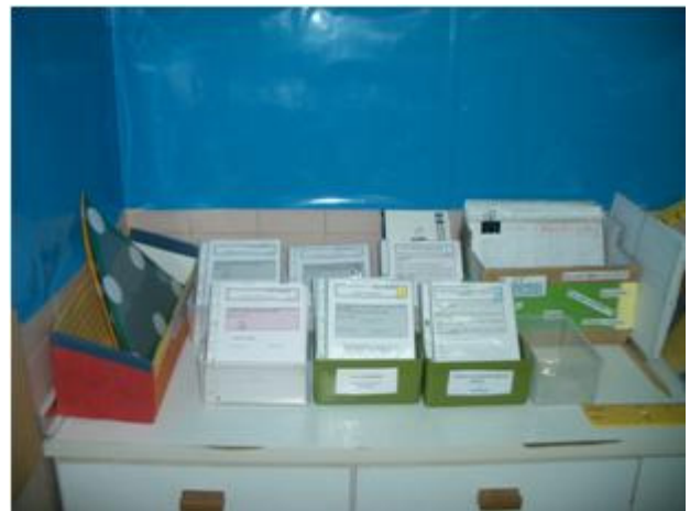
Fig.2 - Zona de ficheiros de Matemática

assemelhado ao de um pequeno empresário, na hora de inaugurar loja nova. Há sempre qualquer coisa que ainda não está bem, ainda há tanto por fazer!... Mas é preciso abrir para começar a reaver o investimento, mesmo sem algumas «licenças»! (saber experiente, domínio do negócio, ...)